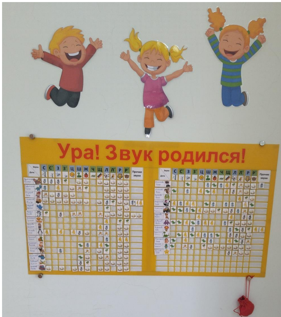
Рис.1. Экран звукопроизношения «Ура! Звук родился!»